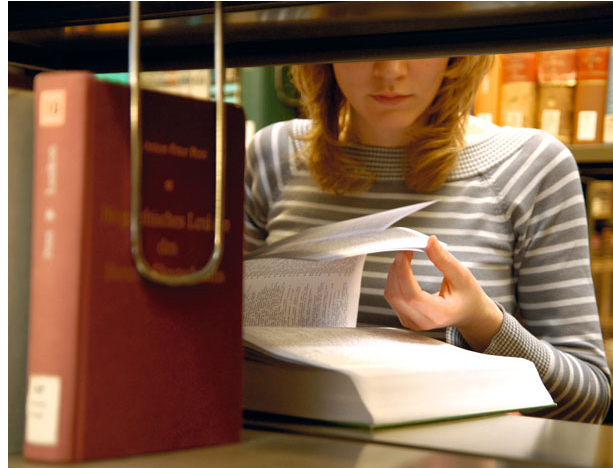
Wer sich in der Unibibliothek erst noch zurechtfinden muss, kann viele Hilfsangebote in Anspruch nehmen.