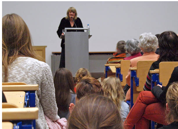
Alice Schwarzer bei ihrem Vortrag im Audimax der Uni Würzburg.

Alice Schwarzer lockte am 25. Oktober ein bunt gemischtes Publikum ins Audimax der Uni Würzburg. Studierende und Berufstätige, Frauen und Männer – jede Gruppe war vertreten. Die Journalistin und Frauenrechtlerin sprach über ein brisantes Thema: die Grenzen der Toleranz gegenüber kulturellen Minderheiten. Mit ihrem Vortrag war Schwarzer einer Einladung des Uni-Projektes „Globale Systeme und interkulturelle Kompetenz“ (GSiK) gefolgt.