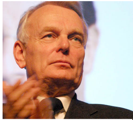
Der französische Premier Jean-Marc Ayrault.