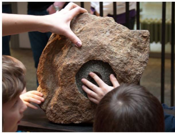
Skulpturen der Bildhauerin Susanne Specht sind noch bis Sonntag im Mineralogischen Museum zu sehen.

In der Ausstellung verzahnt sich die Installation einzigartiger Skulpturen der Bildhauerin mit der Präsentation von geologisch analysierten Eklogitstücken aus der ganzen Welt.