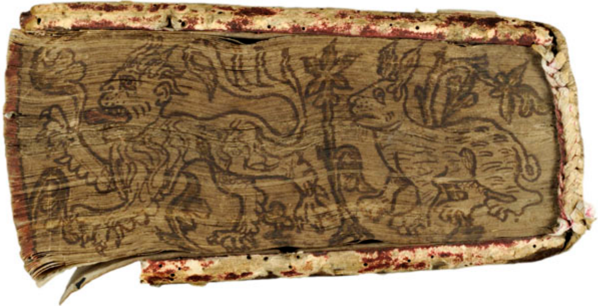
Juristische Handschrift (Winand Ort von Steeg: Lectura Sexti Decretalium) vom Anfang des 15. Jahrhunderts.

An Büchern mit schön gestalteten Einbänden oder an mittelalterlichen Handschriften erfreuen sich viele Menschen. Um die Besonderheiten dieser Werke geht es am Freitag, 9. November, bei einer öffentlichen Führung in der Unibibliothek.