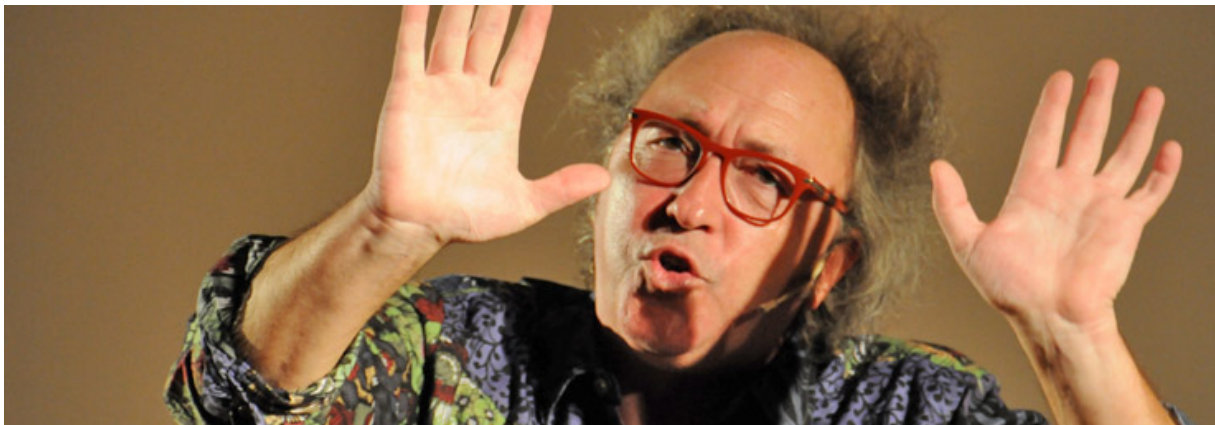
Kabarettist und Uni-Alumnus Urban Priol trat in Würzburg vor anderen Alumni auf.

Drei Stunden lang begeisterte Kabarettist Urban Priol 750 Gäste bei einem Auftritt an der Uni. Der ehemalige Student ließ sich über Politik und Gesellschaft aus, hatte aber auch Anekdoten aus seiner Würzburger Studienzeit mitgebracht.