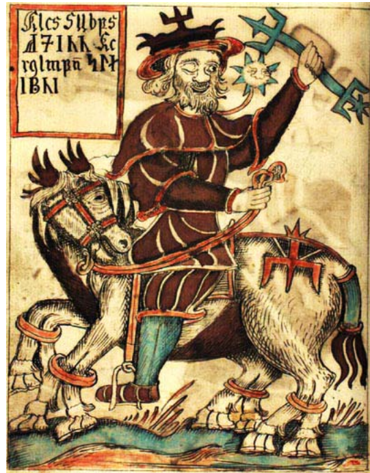
Der einäugige Odin auf seinem achtbeinigen Pferd Sleipnir in einer isländischen Handschrift des 18. Jahrhunderts.

Es geht um die Asen, die Götter der nordischen Mythologie, zu denen Odin, der Allvater, der einäugige Himmelsgott, und Thor, sein Sohn, zählen. Freya, die Göttin der Liebe, spielt eine wichtige Rolle, und jede Menge Fabelwesen wie Elfen, Kobolde und Wichtel tauchen auf. Opferfeste und rituelle Trinkgelage sind zentraler Teil der Religionsausübung; die Bücher der Edda, skandinavische Götter- und Heldensagen aus dem 13. Jahrhundert, dienen als Vorlage.