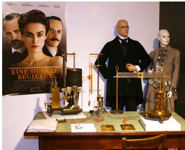
An solch einem Spiegelgalvanometer testet C. G. Jung alias Michael Fassbender seine Patientin, gespielt von Keira Knightley, in dem Film "Eine dunkle Begierde". Im Adolf-Würth-Zentrum für Geschichte der Psychologie kann das Gerät besichtigt werden.

Wer sich selbst ein Bild von den Ursprüngen der Psychologie als Wissenschaft machen möchte – oder wer nur einmal das Gerät ausprobieren möchte, das schon Keira Knightley in den Händen hielt, der hat im Adolf-Würth-Zentrum für Geschichte der Psychologie der Universität Würzburg dazu die Gele-