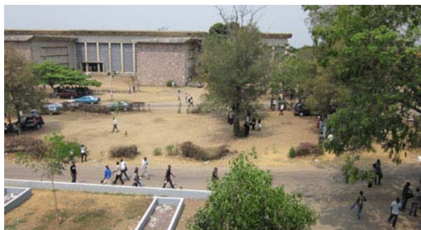
Blick auf den Campus der Universität Kinshasa. Die kongolesische Hochschule hat derzeit über 26.000 Studierende.