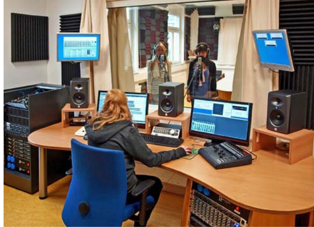
Im Tonstudio: Blick vom Regieraum in einen der Aufnahmerräume.