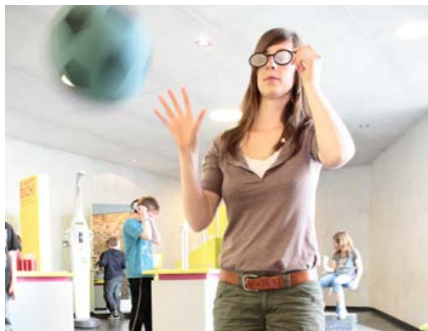
Blick in die Ausstellung "Es betrifft dich!", die sich mit Gesundheit und Gesundheitsforschung befasst.

Was gibt es zu sehen? Kopfmaus, Brillenwand, Gummibärchen kurbeln oder Blutdruck – so heißen einige der 20 Experimentierstationen, an denen Kinder, Jugendliche und Erwachsene die Leistungsfähigkeit des eigenen Körpers erfahren können. An der Station zum Thema Blutdruck zum Beispiel können die Besucher selbst ausprobieren, ob sie mit den eigenen Händen die Arbeit übernehmen können, die ihr Herz Tag für Tag verrichtet. Außerdem erfahren die Besucher, was die Gesundheitsforschung in Deutschland leistet und woran sie arbeitet.