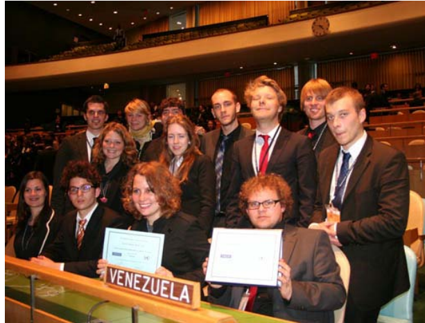
Die Würzburger NMUN-Delegation in der Generalversammlung der Vereinten Nationen.

Die meisten Würzburger Delegierten sind inzwischen wieder zuhause – einige, auch ich, verbringen noch etwas Zeit in den USA, bis das Semester beginnt. Zurück in Würzburg beginnen dann die letzten Aufgaben der Delegation: Wir suchen nach potenziellen Sponsoren für das Projekt, da noch nicht alle Ausgaben gedeckt sind. Und wir machen Werbung – für die neue Delegation, die eine erfolgreiche Würzburger Tradition in New York fortsetzen kann.“