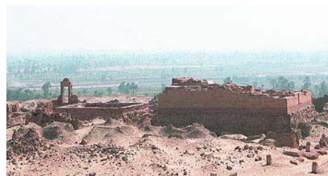
Die ägyptische Oase Fayum steht im Mittelpunkt einer Tagung, die der Lehrstuhl für Ägyptologie der Uni Würzburg Anfang Mai im Kloster Bronnbach veranstaltet.

Zwei Gründe gibt es dafür. Zum einen war das Fayum in der Antike über lange Zeit kontinuierlich besiedelt, denn