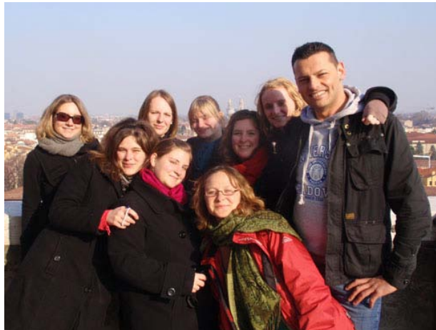
Lehramtsstudierende aus Würzburg auf Exkursion in Padua.