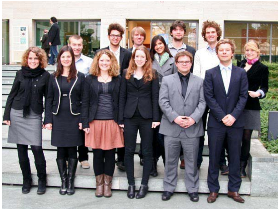
Die Würzburger NMUN-Delegation 2011. Die Gruppe vertritt in New York das Land Venezuela.

Resolutionen aushandeln, um Mehrheiten kämpfen, abstimmen – und das alles auf Englisch. Vom 17. bis 21. April findet in New York das „National Model United Nations“ statt, eine Politik-Simulation der Vereinten Nationen. Auch 14 Würzburger sind bei der Konferenz, die großteils im UN-Hauptgebäude stattfindet, dabei.