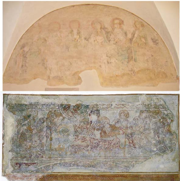
Mittelalterliche Schätze in Thüringen: Oben das Fragment einer Apostelcredo-Malerei in der Kapelle des Wartburgpalas, unten eine Marientod-Darstellung in der Stadtpfarrkirche St. Maria in Weida. So nahe sich die beiden spätromanischen Malereien von ihrer Entwicklungsgeschichte her stehen, so unterschiedlich präsentieren sie sich den Kunsthistorikern: Das auf den ersten Blick schwächere Bild (oben) zeigt – trotz aller Schäden – nur Originalsubstanz. Das Bild unten dagegen ist mit Ausnahme der blässeren Partien ganz rechts von entstehenden Übermalungen der 1930er-Jahre geprägt.

Durch die Zusammenarbeit von Gröschner und Grüger finden malereitechnologische und kunsthistorische Aspekte gleichermaßen Eingang in Dokumentation, Datierung und entwicklungsgeschichtliche Einordnung der Objekte. Ein völlig neuer Ansatz: „So etwas hat es noch nie gegeben“, schwärmen