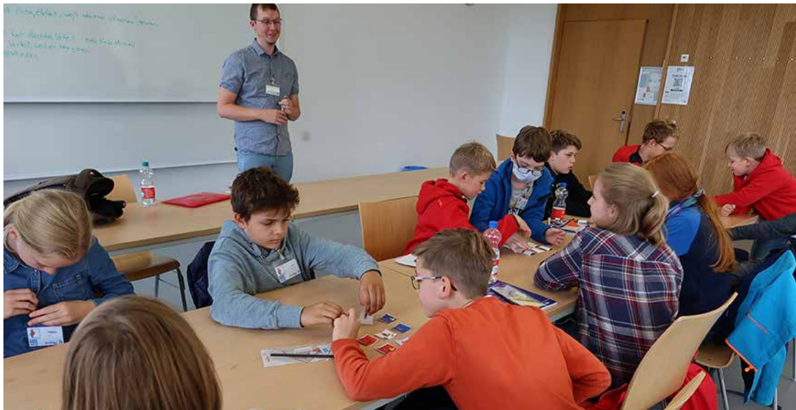
Eifrig bei der Sache: Junge Forscherinnen und Forscher beim neuen Outreach-Programm Würzburg Math Explorers.