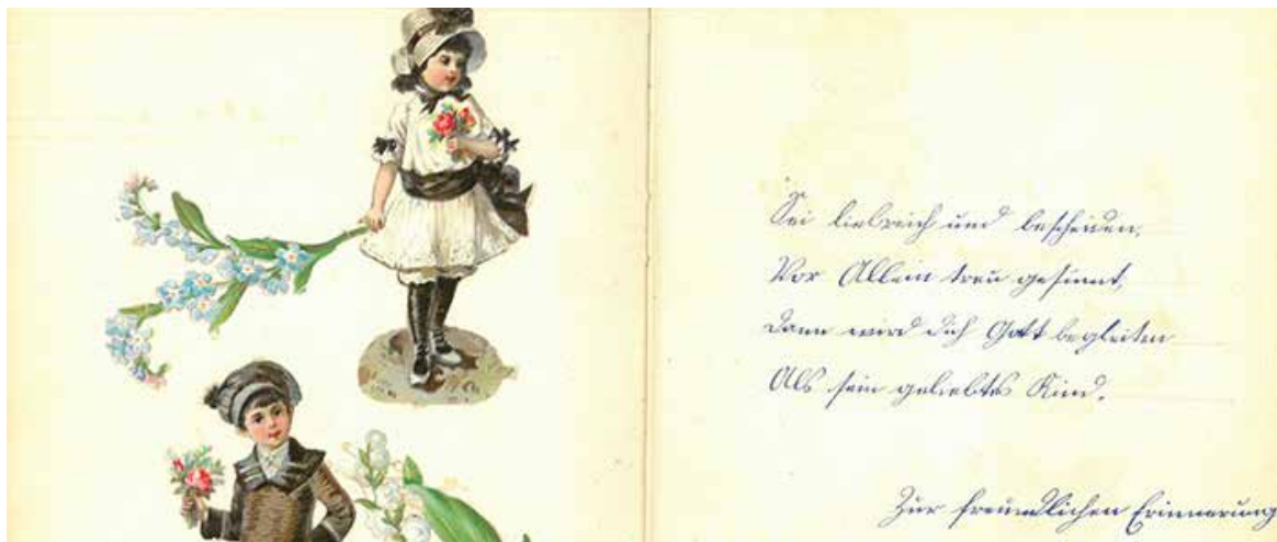
Aus einem Poesiealbum des späten 19. Jahrhunderts. Hier wurde die Kurrent-Schrift verwendet.

Weblink: Projekt UNISONO ( www.unisono-projekt.com )