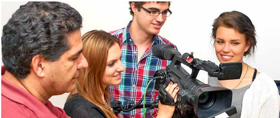
Studierende lernen im Medienkompetenzzentrum der Uni den Umgang mit Medientechniken.

https://eveeno.com/de/event-cal/8123?style=grid&term=entdecken