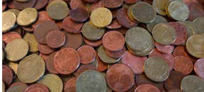
Viele Mineralen stecken in unserem Alltag. Kupfer befindet sich zum Beispiel in Münzen.

Minerale begegnen uns überall im Alltag und oft wissen wir gar nicht, was alles überall drinsteckt. Das Mineralogische Museum der Uni Würzburg bietet daher an einem Schülerforschertag eine besondere Entdeckungstour an.