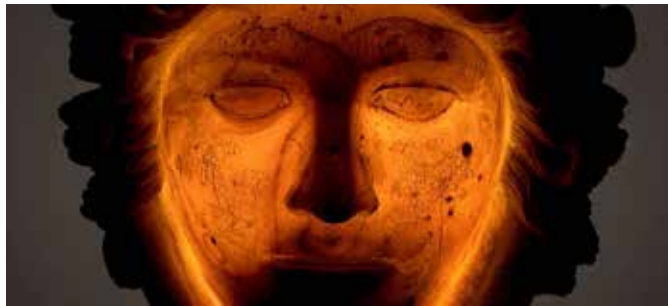
Medusa lebt! Mit Licht wirkt die Maske, eine Kopie der hochklassischen „Medusa Rondanini“ aus dem 19. Jahrhundert, noch magischer.

„Magie: Texte, Praktiken, Stereotypen“: Unter diesem Motto steht die Ringvorlesung des Würzburger Altertumswissenschaftlichen Zentrums im Wintersemester 2019/20. Sie bietet eine breite Palette magischer Kräfte und Praktiken.