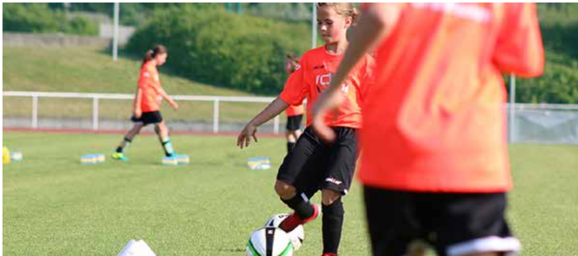
Training an der Uni und Kicken in der Liga: Das bietet das Nachwuchsförderzentrum für Juniorinnen jetzt auch Fußballspielerinnen ab Jahrgang 2009.