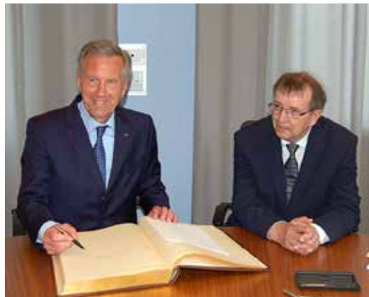
Altbundespräsident Christian Wulff trägt sich ins Gästebuch der Universität ein.