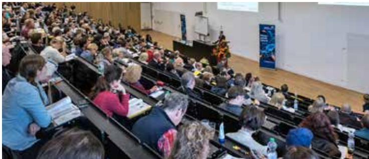
Die Hirntumor-Informationstage – hier im Jahr 2016 in Würzburg – ziehen erfahrungsgemäß viel Publikum an.