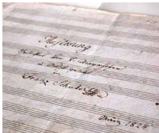
Ein Forschungsobjekt aus dem Sängermuseum: Autograph von Franz Schubert.