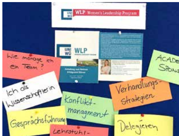
Erfolgreich führen: Das war das Thema der ersten Klausurtagung im Women's Leadership Program.

Diese Fragen standen im Zentrum der Klausurtagung „Erfolgreich führen“ vom 6. bis 7. April 2018 auf der Vogelsburg in Volkach. Sie bildete den Auftakt zu einem neuen Personalentwicklungsangebot für die – bislang noch wenig bedachte – Zielgruppe der Professorinnen, Juniorprofessorinnen und Arbeitsgruppenleiterinnen an der Julius-Maximilians-Universität Würzburg (JMU).