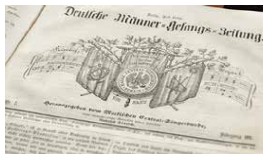
Zum Museumsbestand gehören auch die ältesten Chorzeitschriften der Welt.