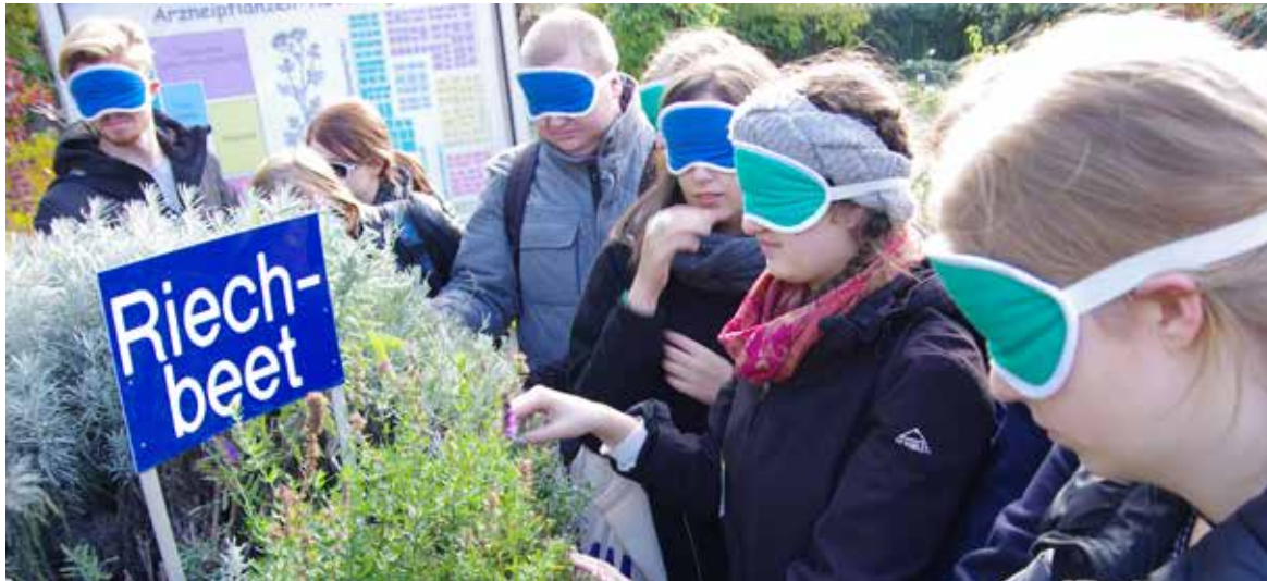
Studierende erkunden „blind“ den botanischen Garten.