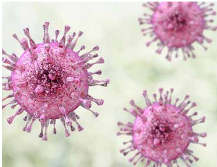
Würzburger Biologen und Informatiker haben ein Analyseverfahren entwickelt, das die Menge der bekannten Proteine der Zytomegalieviren annähernd verdoppelt hat.

Um das möglich zu machen, stellen die Würzburger ihre Analyse-Software quelloffen im Internet zur Verfügung. Sie gehen davon aus, dass ihre Methode breit eingesetzt und international zum neuen Standard bei der Analyse von Ribo-seq-Experimenten wird.