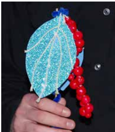
Das kontrastreiche Tastmodell einer Pfefferpflanze soll für blinde und sehbeeinträchtigte Besucher ermöglichen die Pflanze zu erforschen.

renden auch dieses Mal zur Seite und überprüften entsprechend die Entwürfe auf ihre Praktikabilität. Sie haben sich Audiodeskriptionen angehört, den Geländeplan sowie Modelle wie das einer Pfefferpflanze und einer Kakaoschote auf ihre Funktionalität getestet. Außerdem standen sie beratend zur Seite, wenn es darum ging, die Farben auf ihren Kontrastwert hin zu prüfen.