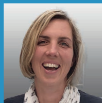
03 DANIELA KETZLER Regierungsrätin Technische Hochschule Ingolstadt