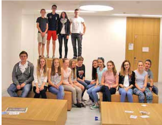
Die Teilnehmer am Unitag im Sommersemester 2015 bei der Abschlussveranstaltung am 10. Juli.

Dr. Richard Greiner, Institut für Mathematik, T (0931) 31-85029, unitag@uni-wuerzburg.de