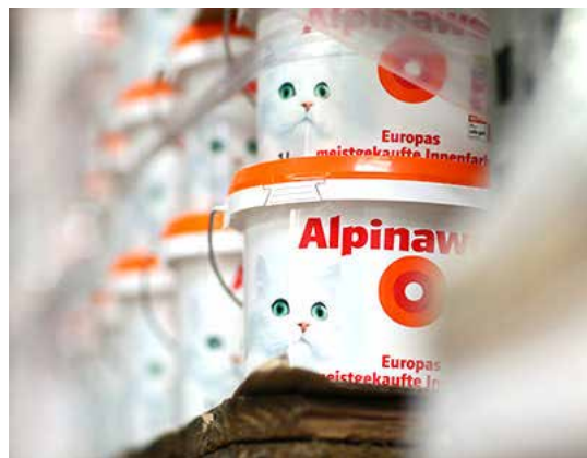
Alpina – eine von insgesamt acht Marken, die unter dem Dach der DAW SE vereint sind. Für Logistiker ist das eine besondere Herausforderung.

Wer schon einmal in einem Baumarkt Farbe gekauft hat, kennt die Eimer mit dem charakteristischen Alpina-Aufdruck. Produkte von Caparol richten sich eher an professionelle Verarbeiter. Die Marke mit dem Elefanten ist allerdings auch unter Laien bekannt, nachdem nicht nur das Brandenburger Tor, das „Vogel-nest“ genannte Olympiastadion in Peking oder erst jüngst das Städel-Museum in Frankfurt ihren Anstrich dem Odenwälder Unternehmen verdanken. Insgesamt acht Marken sind unter dem Dach der DAW SE vereint; das familiengeführte Unternehmen ist damit ein europaweit führender Anbieter von Beschichtungssystemen – sprich: Farben, Lacke, Dämmstoffsysteme und vergleichbare Produkte. Ihren Hauptsitz hat die DAW SE in Ober-Ramstadt im Odenwald, weltweit beschäftigt sie rund 5.600 Mitarbeiter, 3.500 davon in Deutschland.