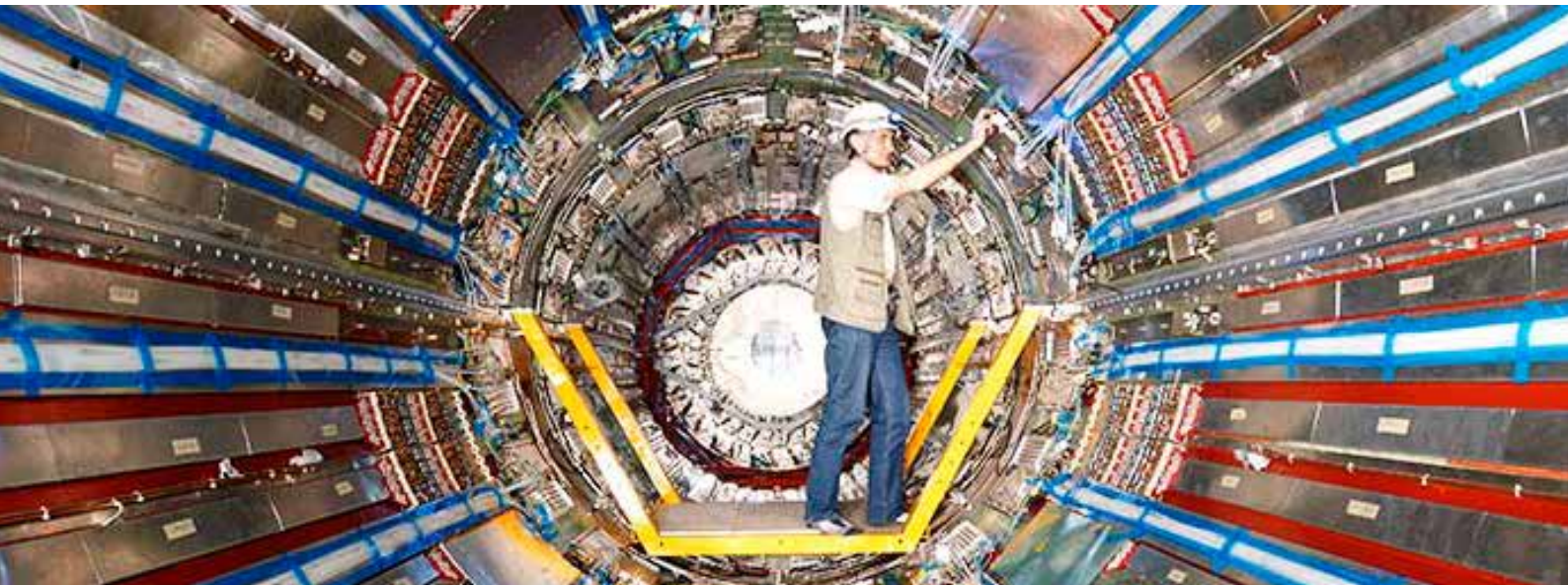
Arbeiten am inneren Detektor des ATLAS-Experiments.