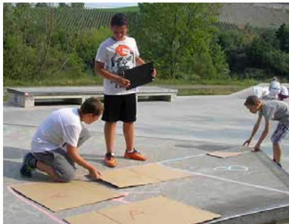
Drei Schüler bei Vorarbeiten zur Flächenbestimmung im Würzburger Skatepark. Bei dem Projekt ging es darum, Plätze und Gebäude in Würzburg mit Mathematik in Verbindung zu bringen.

Verteilt auf verschiedene Tage und Plätze haben an dem Projekt teilgenommen: Schüler einer inklusiven Tandemklasse (maximale Heterogenität) der vierten Jahrgangsstufe der Heuchelhof-Grundschule und eine Parallelklasse mit Schülern, die über geringe Deutschkenntnisse verfügen und überwiegend einen Migrationshintergrund haben. Aus dem Mittelschulbereich kam eine inklusive Tandemklasse der fünften Jahrgangsstufe der Heuchelhof-Hauptschule. Aus der Don-Bosco-Förderberufsschule war ebenfalls eine Klasse dabei.