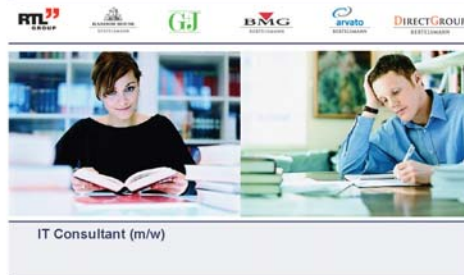
IT Consultant (m/w)

Die empolis GmbH, The Information Logistics Company, ist führender Anbieter von unternehmensweiten Content- und Knowledge-Management-Lösungen. Eine mehr als 20jährige Erfahrung und umfassendes Know-how sowie die Kenntnis komplexer Unternehmensstrukturen sind die Basis unseres spezialisierten Lösungsangebots für eine Vielzahl unterschiedlicher Anwendungsszenarien.