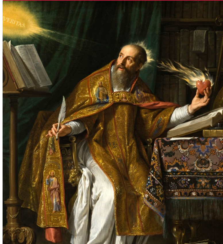
Der Wahrheit verpflichtet: Augustinus von Hippo. Philippe de Champaigne (um 1645–1650). County Museum of Art, Los Angeles

Ihre Anmeldung erbitten wir bis 13. Mai 2019