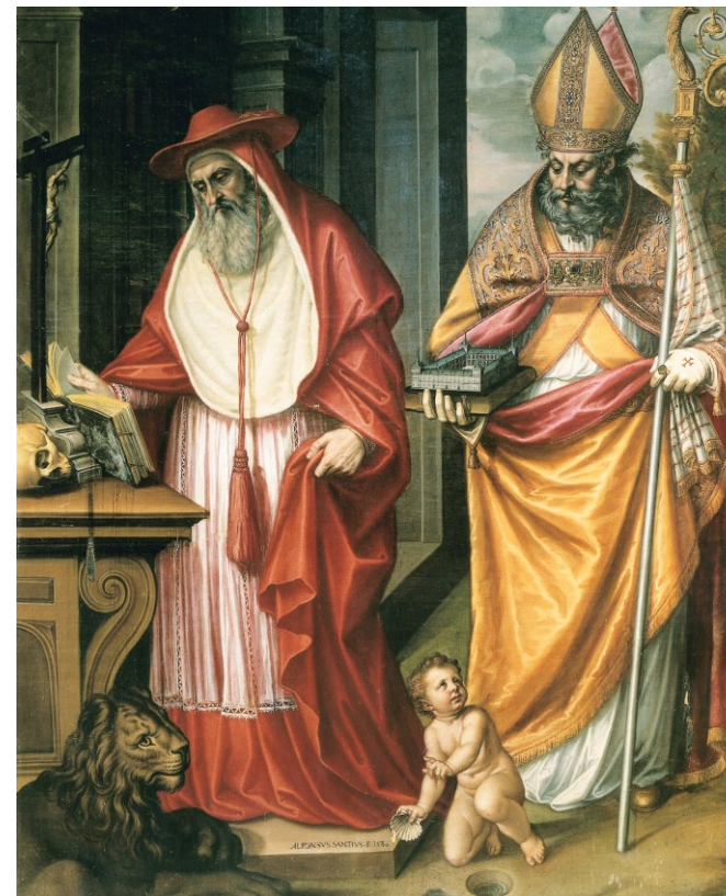
Die Kirchenväter Hieronymus und Augustinus Alonso Sanchez Coello (1580-1582). El Escorial, Madrid

Augustinus, De origine animae / Über den Ursprung der Seele