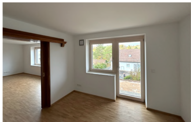
Blick von Wohnen/Arbeiten in Wohnen