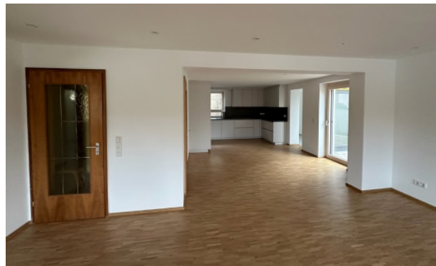
Blick von Wohnen in die Küche