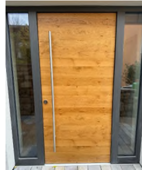
Haustür - Flur 1