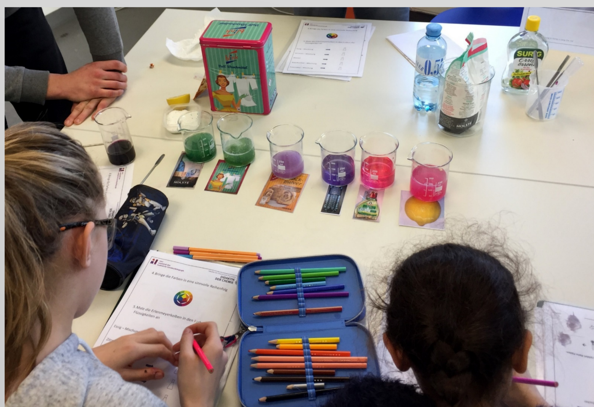
Chemische Experimente zum Thema „Stoffe“ (Weihrach/Goschler 2017)