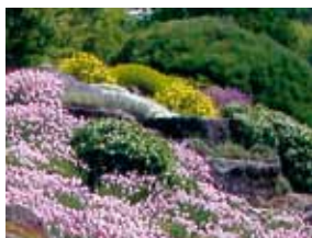
Wrzosey znad Morza Śródziemnego w Ogrodzie Botanicznym