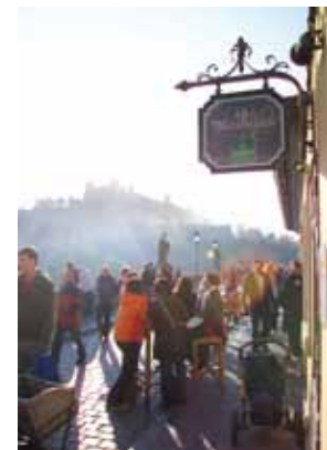
Turyści na Starym Moście (Alte Mainbrücke)

Men odgrywa bardzo ważną rolę w życiu każdego studenta. Nad nim odbywa się największy w Europie Festiwal Afryki, miejska plaża „Stadtstrand” zaprasza do spotkań w letnie popołudnia ze znajomymi. W czasie tak zwanego Hafensommer odgrywane są na rzekę sztuki teatralne. Koncerty w ramach Festiwalu Mozartowskiego grane są w romantycznej atmosferze barokowych ogrodów