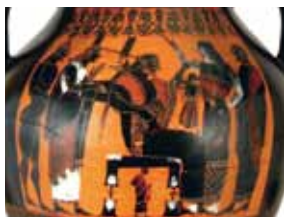
Antyczna waza w Muzeum im. Martina von Wagner