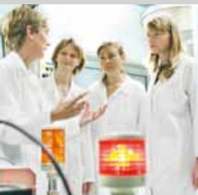
Profesor ze studentami w laboratorium podczas badań

Wydział Inżynierii Nanostruktur i Fizyki jest członkiem bawarskiej elitarniej sieci naukowej Elitenetzwerk. Studia medyczne, farmacja, stomatologia oraz prawo kończą się egzaminem państwowym.