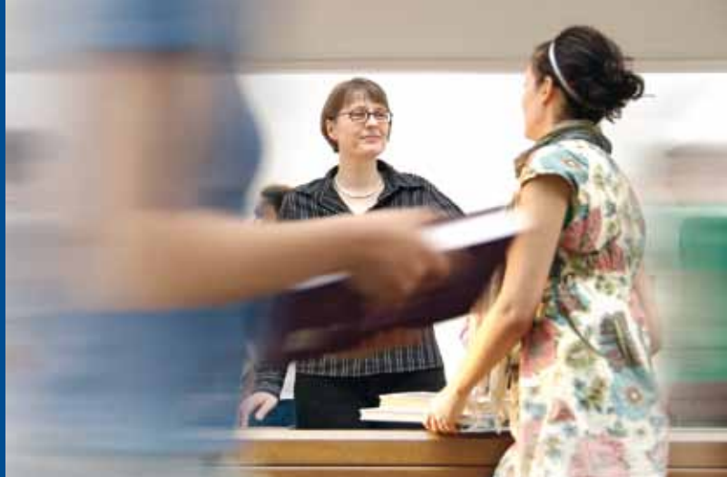
Profesjonalne doradztwo w Bibliotece Uniwersyteckiej i innych instytucjach