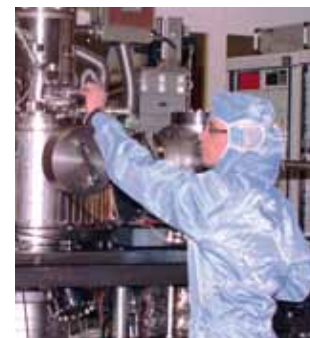
Badania w nanotechnologii

W celu promowania studiów doktoranckich na uniwersytecie utworzone zostały Graduate Schools, dziś otwarte dla doktorantów ze wszystkich dziedzin naukowych. W ramach państwowego wsparcia wybitnych projektów na uczelniach niemieckich (Exzellenzinitiative) zostały utworzone studia doktoranckie na naukach przyrodniczych.