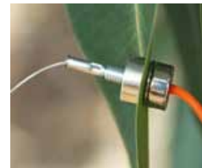
Sonda magnetyczna, którą mierzone jest zaopatrzenie w wodę: wynalazek Uniwersyteckiego Centrum Biologicznego