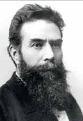
Fizyk Wilhelm Conrad Röntgen odkrył w 1895 r. w Würzburgu, nazwane później jego imieniem promienie.

Przez lata zarówno powierzchnia kampusu jak i oferta kierunków studiów uniwersytetu znacząco się rozwinęła. Od 1960 r. kampus rozszerza się z centrum miasta w kierunku wzgórz, na wschodnim skraju miasta (Hubland). Bogaty w zielen kampus zapewnia dogodnie studiowanie na naukach ścisłych i humanistycznych, tam też znajdują się akademiki, główna biblioteka, stołówka i tereny sportowe.