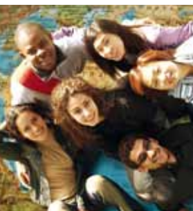
Würzburg przyciąga studentów z całego świata

Małymi dziećmi opiekuje się Uniwersyteckie Biuro Rodzinne na Hublandzie