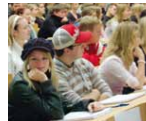
Wykład w Audimaxie

10 000 osób pracuje na uniwersytecie i w Klinice Uniwersyteckiej, w tym około 3 000 pracowników naukowych i 400 profesorów.