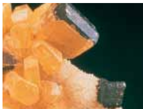
Kryształy siarki w Muzeum Mineralogicznym

Dziedziniec Starego Uniwersy- tetu z wieżą kościelną