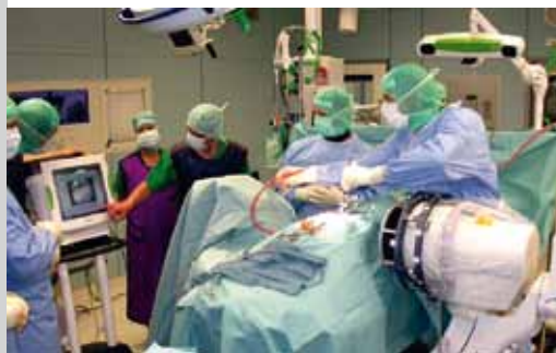
Operacja w Klinice Uniwersyteckiej z użyciem komputerowej nawigacji

W klinice uniwersyteckiej leczy się co roku około 50 000 pacjentów. W 2004 r. w dzielnicy miasta Grombühl zostało otwarte nowe Centrum Operacyjne (ZOM). W 2009 r. otwarto również Centrum Internistyczne (ZIM).