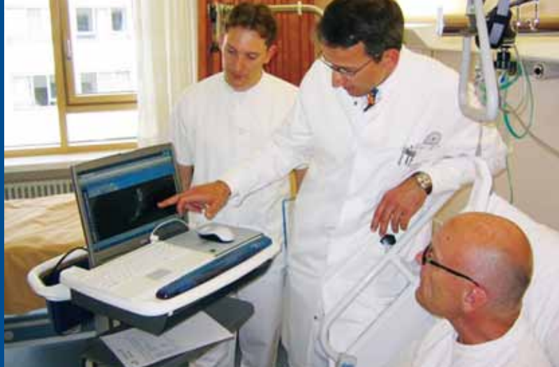
Rozmowa z pacjentem w Klinice Uniwersyteckiej

Rankingi potwierdzają wiodącą pozycję naszego uniwersytetu. Według renomowanego „Academic Ranking of World Universities” znajdujemy się wśród 200 najlepszych uniwersytetów świata w dziedzinie nauk ścisłych, a w Europie wśród najlepszych trzydziestu uczelni. W rankingu Centrum Rozwoju Szkolnictwa Wyższego (CHE) szczególnie