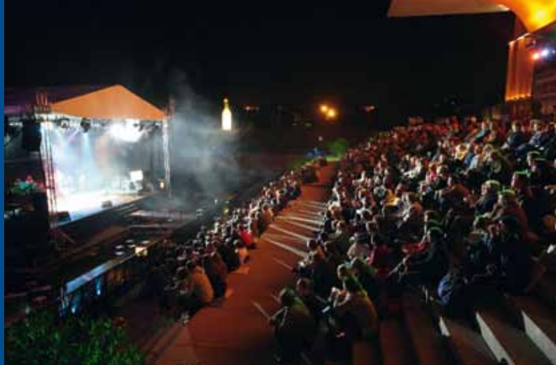
Koncert podczas Hafensommer

Rezydencji Biskupiej (Residenz wpisana jest na listę UNESCO).