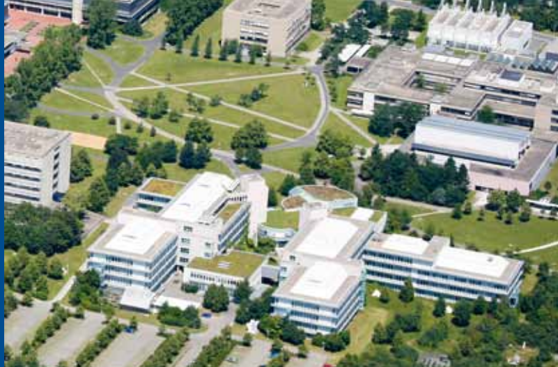
Rzut z lotu ptaka na Campus na Hublandzie