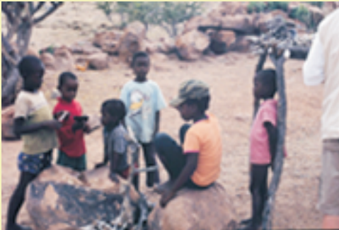
Herero Kinder beim Spielen