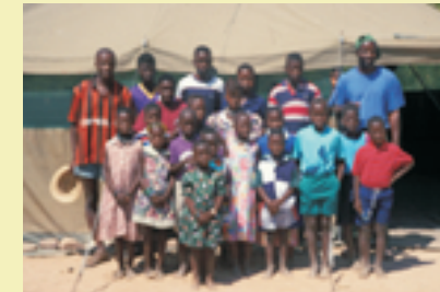
Mobile Schule im Norden Namibias, hier werden etwa 60 Schüler der Klassen 1 bis 4 unterrichtet.