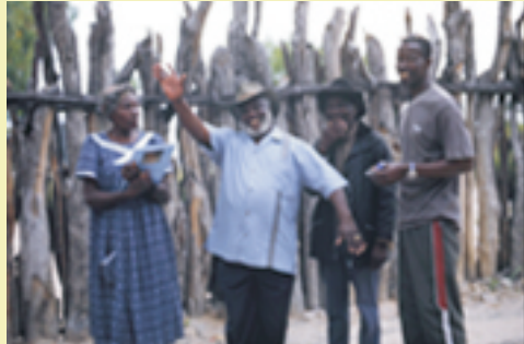
Der Ovambokönig begrüßt die Würzburger Exkursionstruppe im Frühjahr 2006.