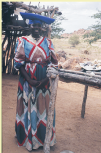
Herero Frau in typischer Tracht an ihrem Verkaufsstand