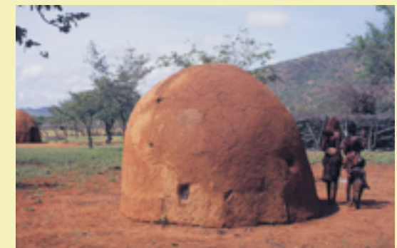
Himba Hütte aus biegsamen Ästen, die mit einer Schicht aus Kuhdung und Lehm (von Termitenhügeln) abgedeckt sind. Nahe Omarunga Camp Epupa.