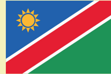
Die namibianische Flagge