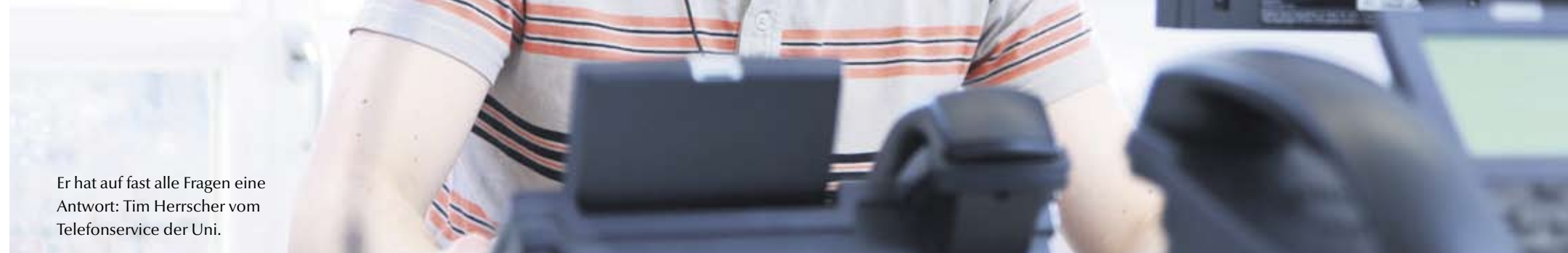
Er hat auf fast alle Fragen eine Antwort: Tim Herrscher vom Telefonservice der Uni.

318 318 3 – unter der Nummer des Telefonservices gibt's Antworten auf alle Fragen rund ums Studium.