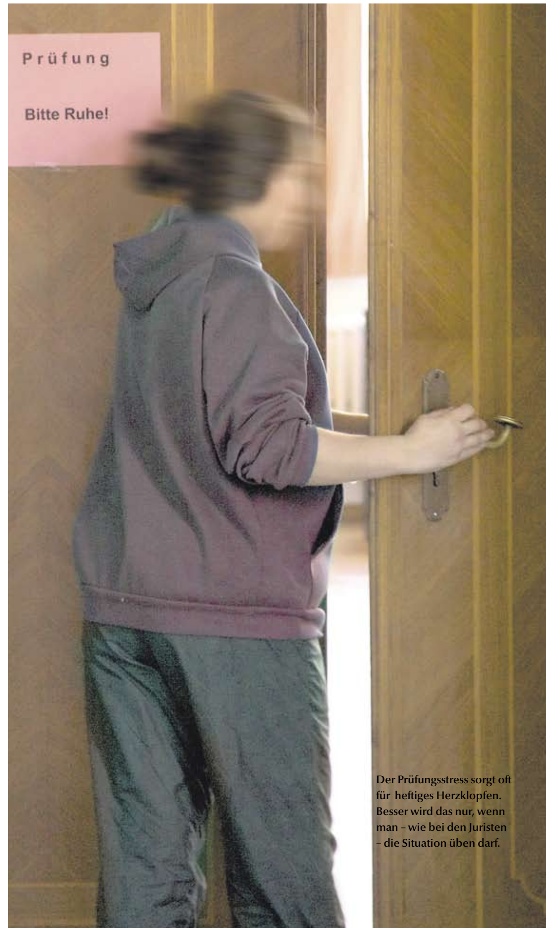
Der Prüfungsstress sorgt oft für heftiges Herzklopfen. Besser wird das nur, wenn man – wie bei den Juristen – die Situation üben darf.

Seit 2003 können Würzburger Jura-Studenten fürs mündliche Staatsexamen proben.