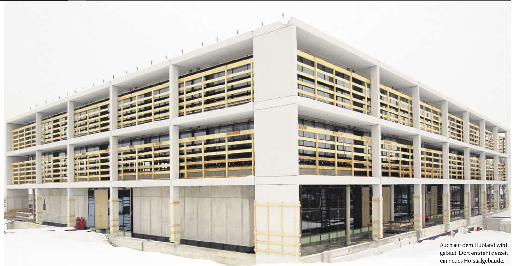
Auch auf dem Hubland wird gebaut. Dort entsteht derzeit ein neues Hörsaalgebäude.

39 Hektar Grund, rund 15 000 Quadratmeter Nutzfläche – wo bis vor einem Jahr die US-Streitkräfte stationiert waren, entsteht ein neuer Campus. Der Umbau ist in vollem Gange, in einem Jahr wird auf dem Gelände gelehrt und geforscht.