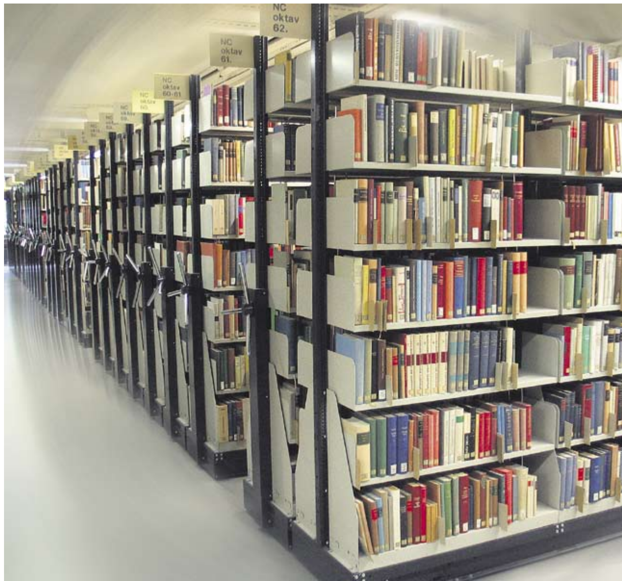
So kennt man die Universitätsbibliothek. Ganz andere Einblicke bieten einmal im Monat die Führungen.