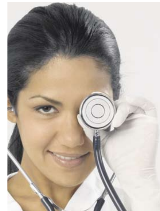
Medizinstudenten mit Auslandsambitionen sollten sich das Programm von Spass.med anschauen.

staltungen sollen die Studierenden die Möglichkeit haben, Kontakte zu knüpfen, Erfahrungen auszutauschen und voneinander Neues zu erfahren. So können „Auslandsambitionierte“ andere Kommilitonen treffen, die aus ihren Wunschländern stammen oder von einem Aufenthalt dort zurück sind; Neu- und Gast-Würzburger wiederum lernen hier nette Menschen in ihrer neuen Studien- oder Berufsheimat kennen. Die nächsten Termine stehen bereits fest: Am 29. April, 17.30 bis 19.30 Uhr, spaziert Spass.med „Auf den Spuren des Schwedenkönigs“. Dahinter verbirgt sich eine etwas andere Stadtführung durch die Würzburger Altstadt. Danach ist eine Diskussionsrunde zum Thema „Medizinstudium in Schweden“ geplant. Im Mai soll es dann eine Veranstaltung unter dem Titel „Der Canon medicinae des Avicenna in Europa“ geben. Als Referent ist Dr. Johannes Mayer vom Institut für Geschichte der Medizin eingeladen. Anschließend will die Gruppe die Moschee in Würzburg besuchen. Für die Mai-Veranstaltung steht allerdings noch kein genauer Termin fest. Der wird aber bald auf den Flyern und Plakaten stehen, mit denen Spass.med für seine Treffen wirbt.