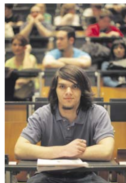
Begabt, wissbegierig, eifrig: Das Frühstudium holt Schüler an die Uni.