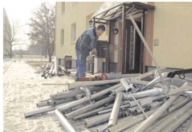
Der Umbau läuft auf Hochtouren: Arbeiter entkernen Gebäude auf dem Leighton-Areal.

K aum ein halbes Jahr ist es her, dass 39 Hektar des Leighton-Areals in den Besitz des Freistaats Bayern – und damit der Würzburger Universität – übergegangen sind. Noch gut ein Jahr, dann wird auf dem Areal neues Leben eingekehrt sein. Dann wird dort ein neuer Campus entstehen – direkt neben dem Hubland-Gelände der Universität. Das Leighton-Areal – ein Glücksfall! Ein Glücksfall für Würzburg und ein ganz besonderer für die Universität. Auf einen Schlag hat sich der bisherige Hubland-Campus flächenmäßig nahezu verdoppelt. Wenn im kommenden Jahr zwei Abiturjahrgänge vor den Hörsaal Türen stehen, kann die Julius-Maximilians-Universität ihnen ausreichend Kapazitäten bieten. 28,5 Millionen Euro investiert der Freistaat Bayern in die erste Phase der Erschließung des Leighton-Areals. Bis April 2011 soll sie abgeschlossen sein.