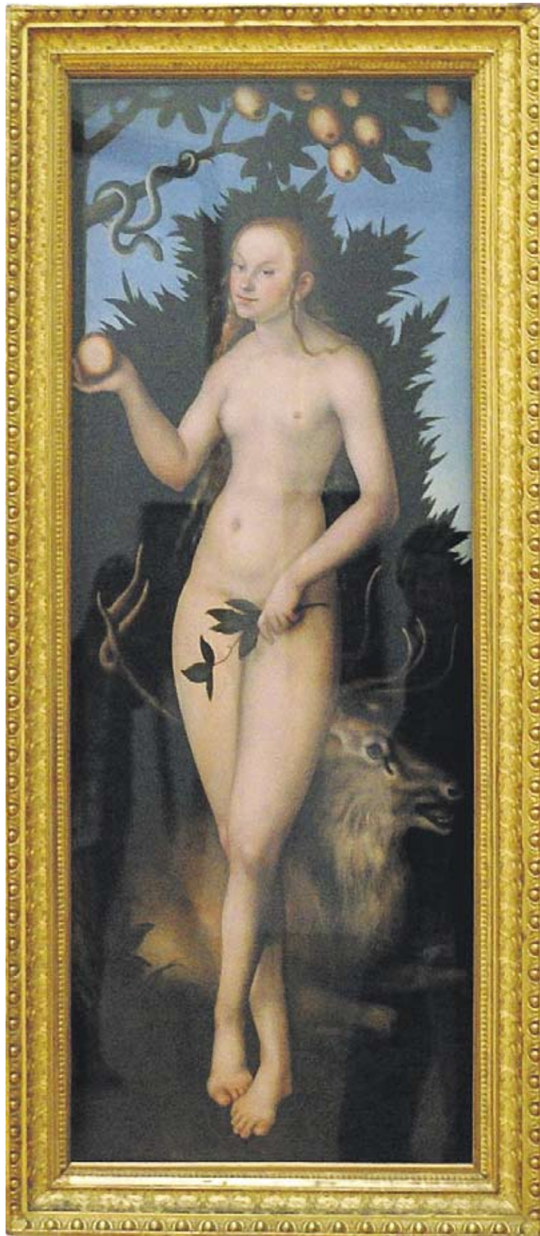
Eva, wie Lucas Cranach sie um 1500 sah.

Auf die Theologie brachte sie übrigens „ein toller Religionslehrer“, erzählt die 30-Jährige. Im Diplomstudiengang war sie dann eine der wenigen Studien-