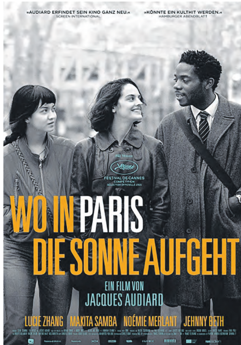
Filmposter „Wo in Paris die Sonne aufgeht“