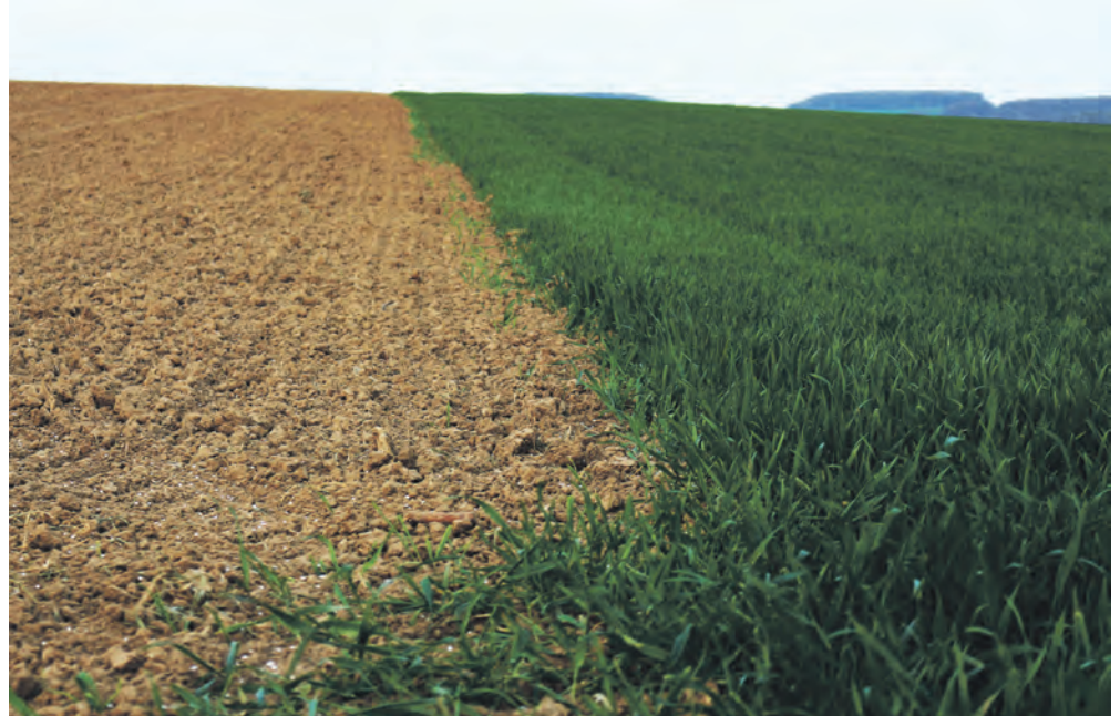
Eine Seite wählen.

Besonders die Studiums- und Berufswahl sind für Studierende relevante Themen. Jeder hat sich damit bereits auseinandergesetzt. Meist ist es nicht so, dass Menschen von Geburt an nur eine Perspektive haben, die bis zum Lebensende hin verfolgt wird. Sie alle haben immer wieder Ideen, denken darüber nach, zerbrechen sich den Kopf und verwerfen die zu Beginn so berauschenden Gedanken immer wieder. Diese Unmengen an Möglichkeiten werden auf der Suche nach dem richtigen Weg durchforstet. Die Menschen suchen nach Glück, Berufsperspektiven und guten Gehaltschancen. Jeder setzt andere Prioritäten und lässt seine Entscheidung durch diese beeinflussen und steuern. Doch irgendwann trifft das Individuum eine Wahl. Das kann sehr schwer sein, denn solch eine Entscheidung wirkt sich in gewisser Weise auf das gesamte Leben der Menschen aus. Klar werden heutzutage viele Umschulungen und Möglichkeiten für Quereinsteiger:innen geboten.