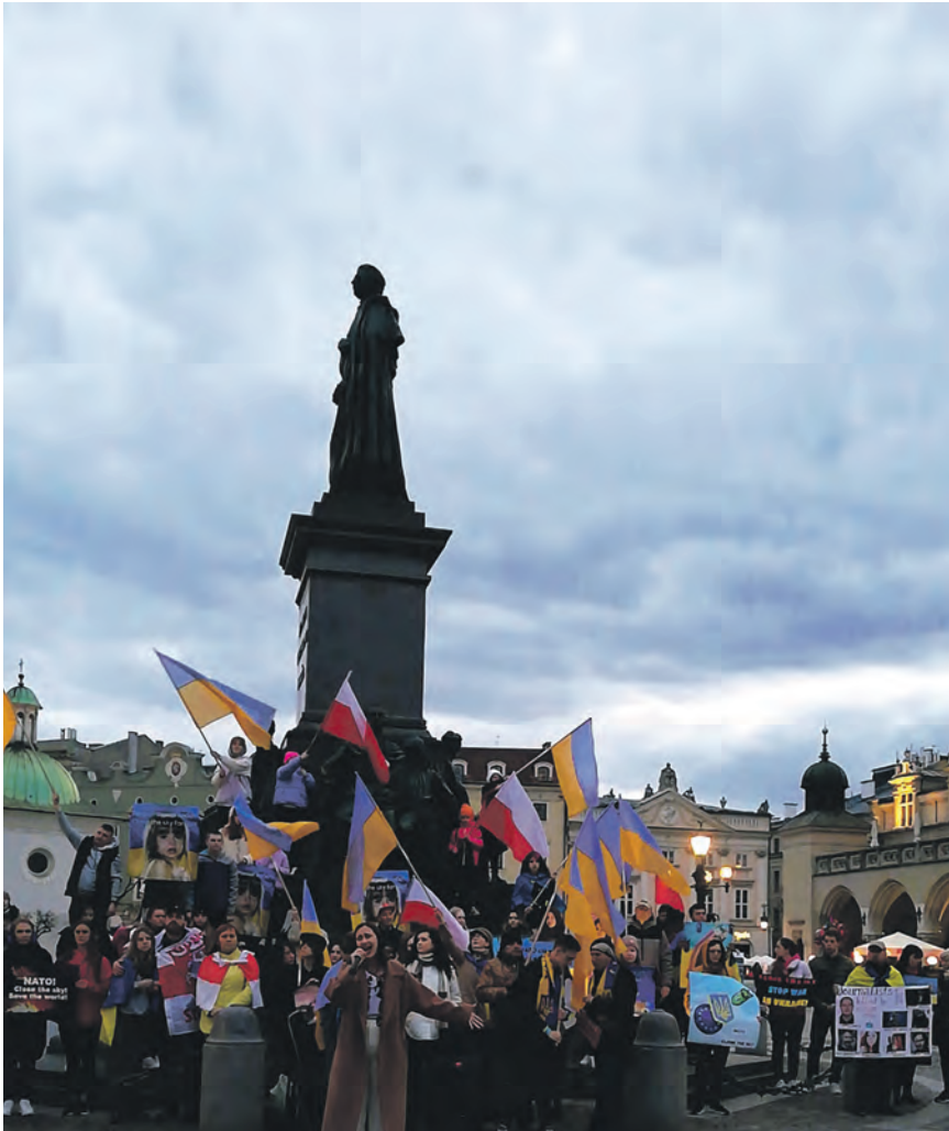
Der verzweifelte Ruf nach Frieden.