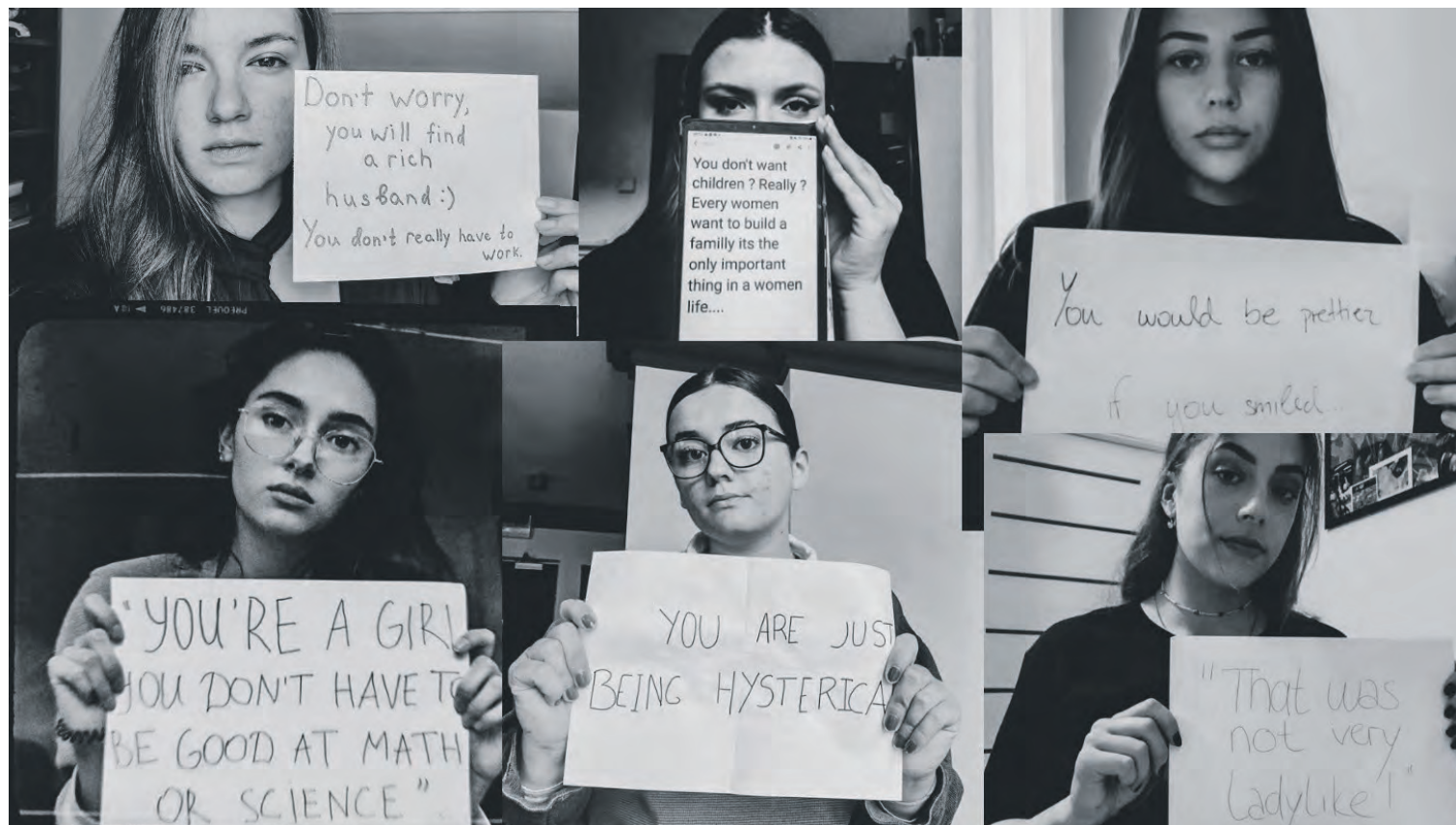
Stop being so sensitive.

About the variety of microaggressions women* face on a daily base, why feminism is still much needed and why words matter more than some actually think.