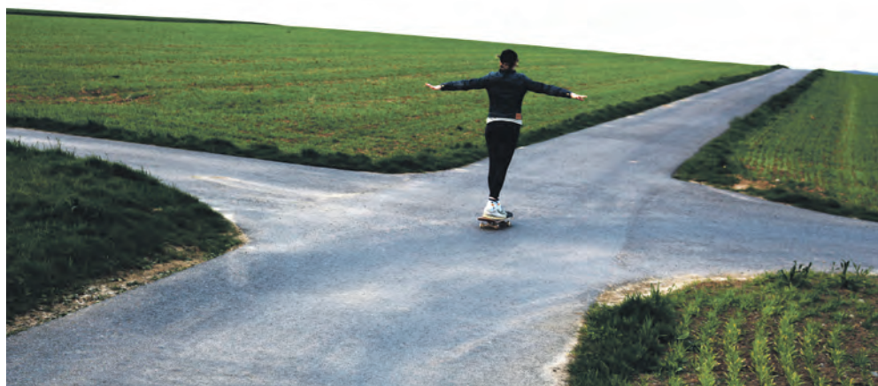
Zwischen den Möglichkeiten unterwegs..

Die Situation darf vielen bekannt vorkommen: Man möchte entspannen, für den Moment