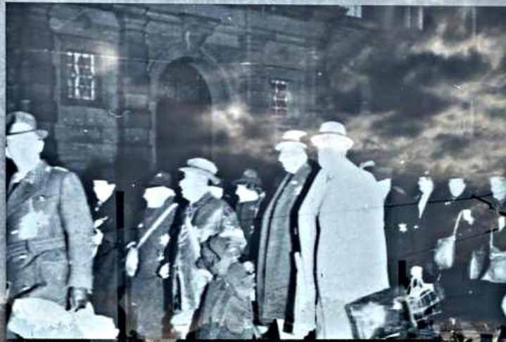
Der nächtliche Weg zur Aumühle vor der 1. Deportation. The deportees of the first deportation walk in the darkness of night to Aumühle station.

Als die jüdische Bevölkerung Unterfrankens durch den nationalsozialistischen Staat deportiert wurde, mussten sich die meisten Menschen in Würzburg sammeln.