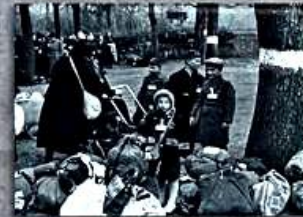
Eine wartende Familie am Sammelort Platzscher Garten. A family waits at the collection centre at Platzscher Garten.

Wir wollen diese Menschen nicht vergessen.