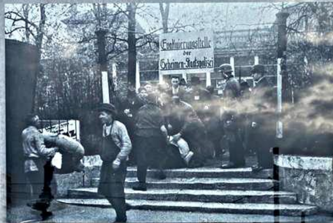
Der Eingang zum Sammelort Platzscher Garten. The entrance to the collection centre at Platzscher Garten.

Die Geheime Staatspolizei (Gestapo) in Nürnberg und in Würzburg organisierte die Abtransporte der jüdischen Bevölkerung in den Jahren 1941-1944. Aus ganz Unterfranken wurden Männer, Frauen und Kinder nach Würzburg gebracht. Nur ein Transport startete in Kitzingen.