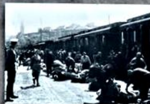
Der Deportationszug am Güterbahnhof Auzonville. The deportation train at Auzonville goods station.

Die Gepäckstücke stehen als Symbol für die Menschen, die nicht mehr da sind. Denn Ideologen sowie Täter und Täterinnen in Politik, Verwaltung, Polizei und Militär haben wie auch einfache Bürgerinnen und Bürger ihren Teil zu einem verbrecherischen System beigetragen, das ihnen ihr Leben nahm.