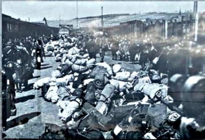
Das große Gepäck der Deportierten vor dem Beschießungslager am Güterbahnhof Auzonville. Large items of baggage before the deportation train at Auzonville goods station.

Zwischen November 1941 und Dezember 1944 wurden 2.069 Menschen aus Unterfranken abtransportiert. Die antisemitische Politik der Nationalsozialisten hatte sie zuvor als Jüdinnen und Juden ausgegrenzt, entrechtet und beraubt. Sie wurden in die von Deutschland besetzten Länder in Osteuropa deportiert und fast alle dort ermordet. Nur 63 von ihnen überlebten.