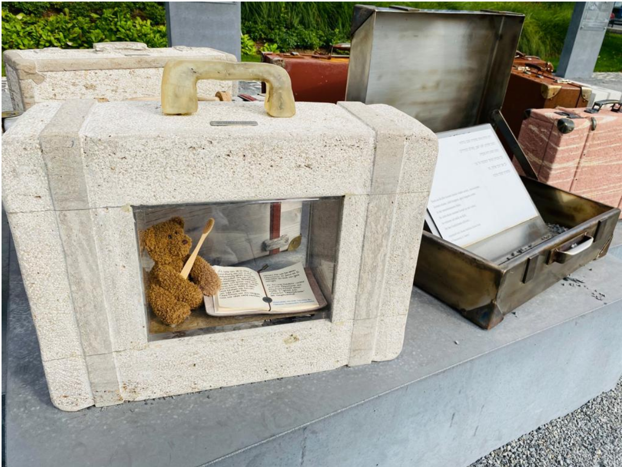
The teddy bear in the suitcase is a reminder that children were also deported.