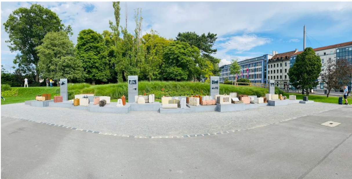
The memorial DenkOrt Deportations from the front.