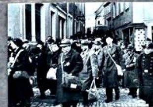
Der Fußweg zum Deportationsbahnhof in Kitzingen. The route taken on foot to the deportation station in Kitzingen.

The last larger transports in the summer of 1943 left from the main station.