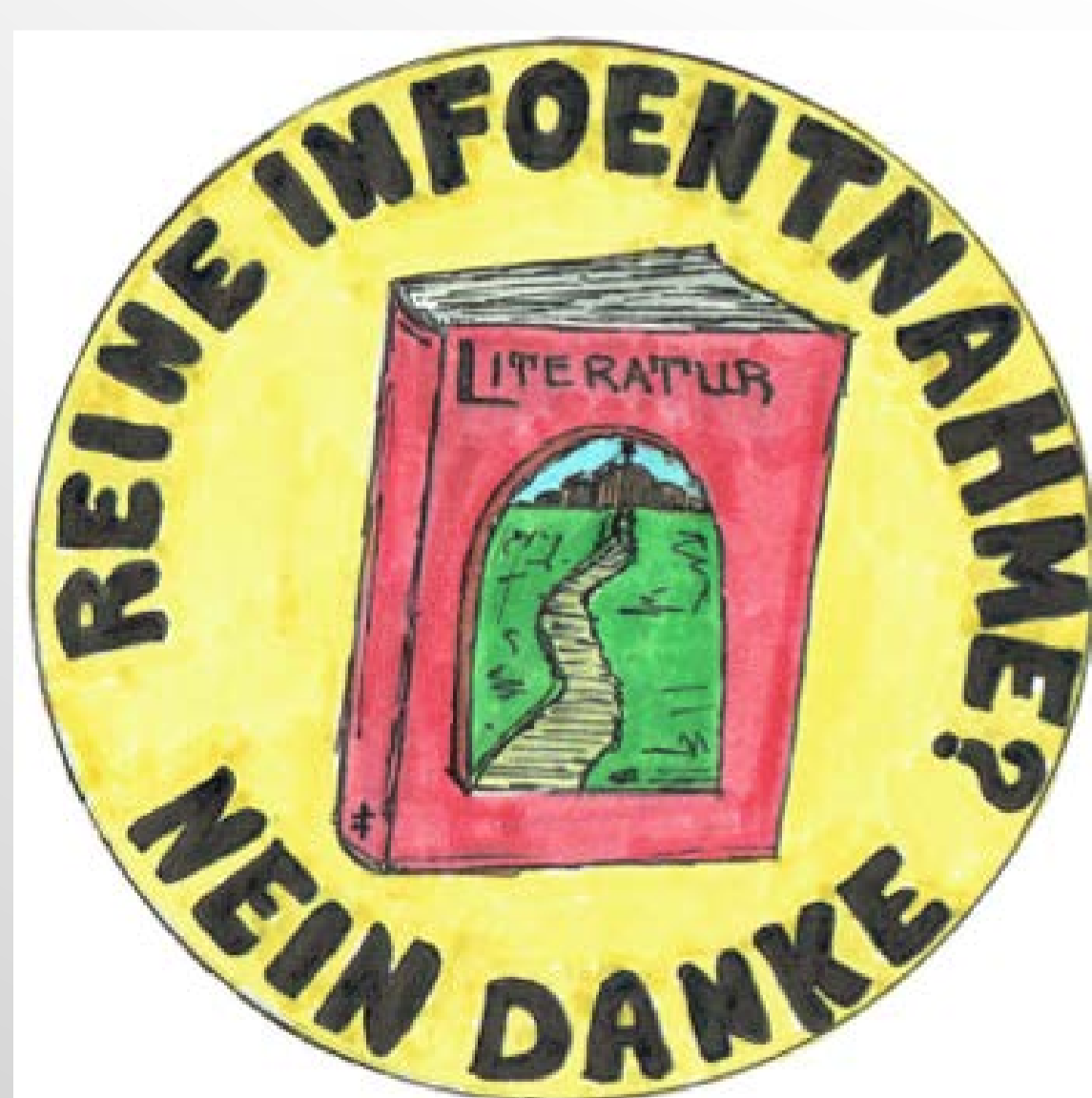
Döll, Philipp (2017).