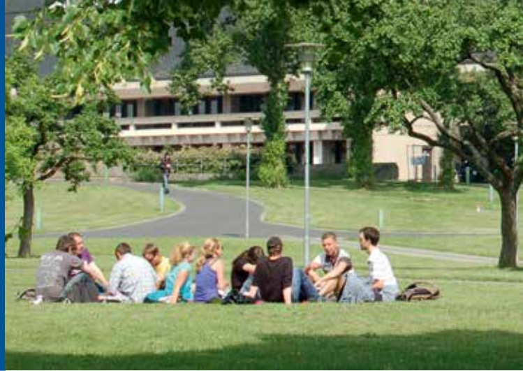
Sommer auf dem Campus am Hubland