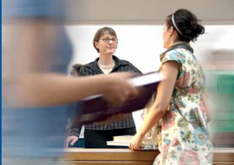
Beratungsgespräch in der Universitätsbibliothek

stik, Russische Sprache und Kultur, Science and Technology, Sonderpädagogik, Sportwissenschaft, Sprachwissenschaft, Wirtschaftsmathematik, Wirtschaftsinformatik, Wirtschaftswissenschaft.