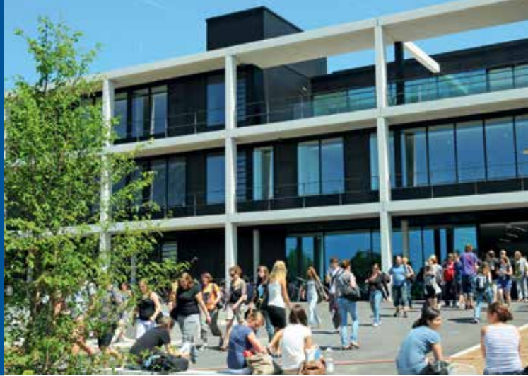
Das zentrale Hörsaal- und Seminargebäude am Hubland-Campus

Kontinuierlich erweitert sich die Julius-Maximilians-Universität: Seit den 1960er-Jahren expandiert sie auf eine Anhöhe am östlichen Stadtrand, ans Hubland. Dort ist ein grüner Campus entstanden,