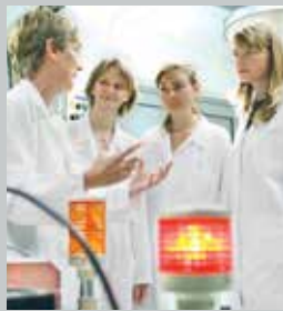
Ausbildung im Forschungslabor

Alte Welt, Anglistik/Amerikanistik, Biologie, Biochemie, Biomedizin, Chemie, Computational Mathematics, Cultural Landscapes, Digital Humanities, Europäische Ethnologie/Volkskunde, Evangelische Theologie, Funktionswerkstoffe, Games Engineering, Geographie, Germanistik, Geschichte, Indologie/Südasienkunde, Informatik, Katholische Theologie, Kunstgeschichte, Kunstpädagogik, Lebensmittelchemie, Life Sciences, Luft- und Raumfahrtinformatik, Mathematik, Mathematische Physik, Medienkommunikation, Mensch-Computer-Systeme, Modern China/Chinese Studies, Museologie, Musikpädagogik, Musikwissenschaft, Nanostrukturtechnik, Öffentliches Recht, Pädagogik, Philosophie, Philosophie & Religion, Physik, Political and Social Studies, Privatrecht, Psychologie, Romani-