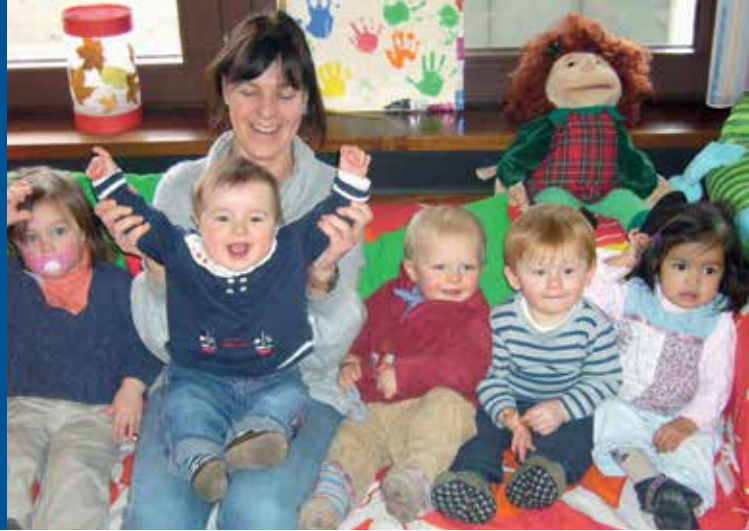
Kleinkinderbetreuung beim Familienservice auf dem Campus