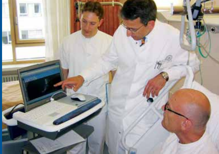
Arzt-Patienten-Gespräch im Zentrum für Operative Medizin

Eine „Tankstellenbiene“ flößt ihren Kolleginnen Energie ein. Würzburger Biologen haben diese Spezialisierung entdeckt.